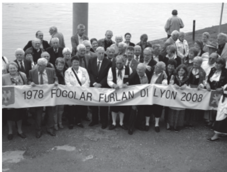
Il grup dai furlans di Lion intant de polse a Trevoux, ad or de Saône, intant de navigazion su lis aghis di Lion